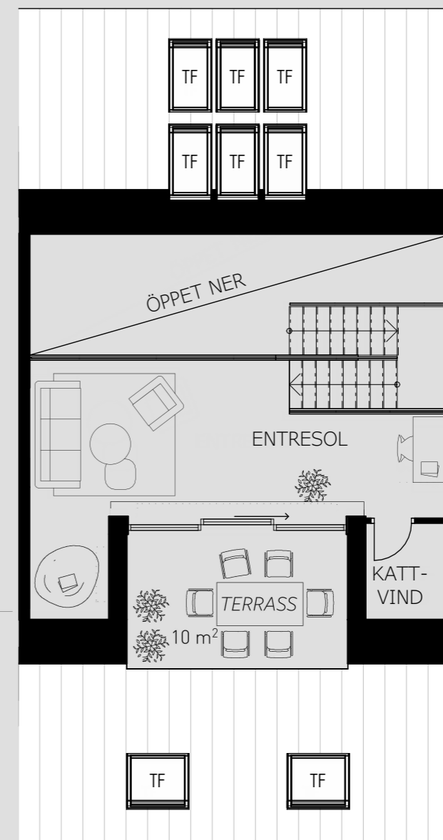
Plan 2 Etage

4 rum och kök 97 KVM + 30KVM 127 kvadratmeter